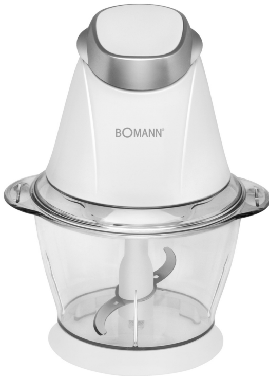
MZ 449 MULTI MIXER